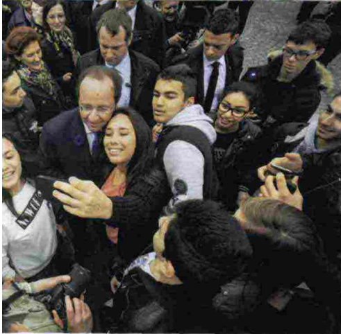
PARIS HILTON SI RITRAE A MALIBU. A SINISTRA: SELFIE CON IL PRESIDENTE FRANCESE FRANÇOIS HOLLANDE