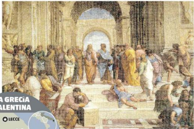
SIMBOLO La Scuola di Atene di Raffaello, con Platone e Aristotele

Lo scrittore svizzero è uno degli esponenti della corrente della «filosofia quotidiana», tradotta in libri molto popolari