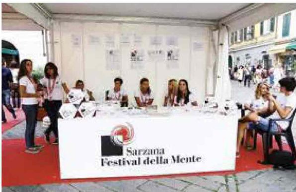
I volontari del point di piazza Luni