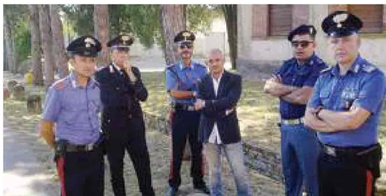
I responsabili dell'ordine pubblico hanno garantito un ottimo servizio