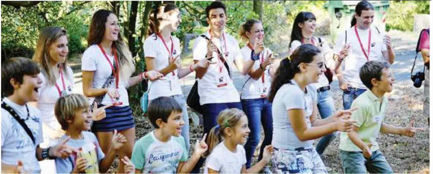
Una immagine dei bambini che hanno camminato nel parco di villa Olandini durante uno degli incontri a loro riservati