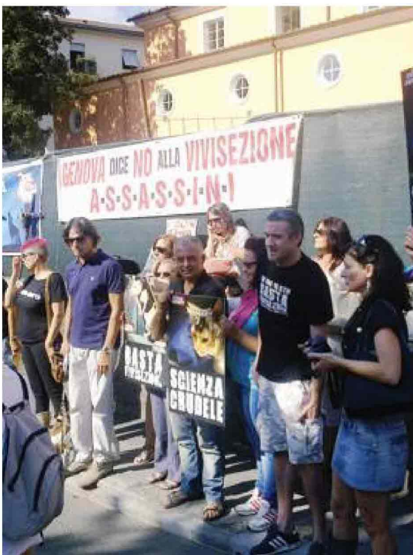
I manifestanti contro la vivisezione