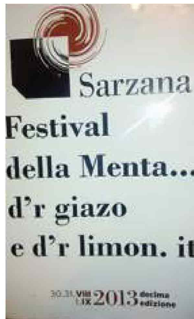
Manifesto goliardico della Gemmi