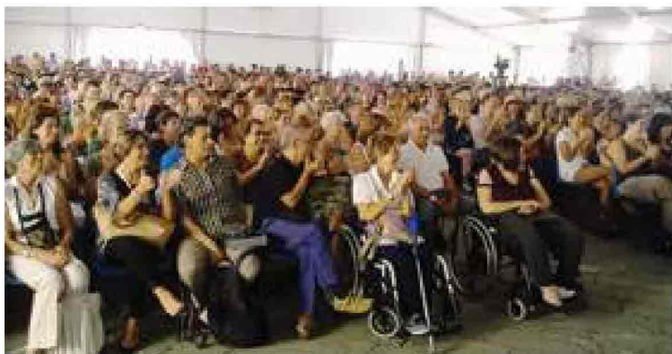
Una delle affollate conferenze in piazza Matteotti