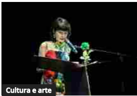
Cultura e arte

LA MILANESIANA 2023 Letteratura Musica Cinema Scienza Arte Filosofia Teatro Diritto Economia Sport Fumetto