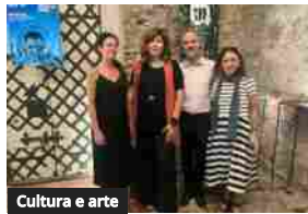
Cultura e arte

LA MILANESIANA 2023 Letteratura Musica Cinema Scienza Arte Filosofia Teatro Diritto Economia Sport Fumetto