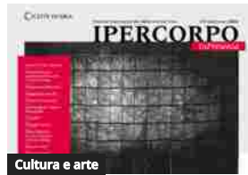
Cultura e arte

L'Istituto Europeo di Design e la Roma Jewelry Week insieme per il nuovo logo della kermesse