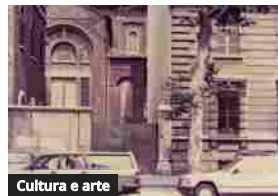
Cultura e arte

Art-Rite casa d'aste | "U-3 UNDER 3K EUROS" – ASTA DI ARTE MODERNA E CONTEMPORANEA, giovedì 14 settembre 2023