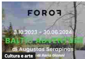
Cultura e arte

Le minoranze storiche in Italia tra antropologia e letteratura