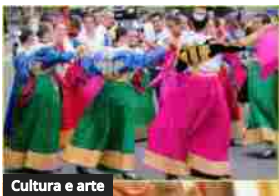
Cultura e arte

Le minoranze storiche in Italia tra antropologia e letteratura