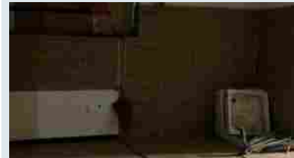
Appartamenti Cinisello Balsamo Caldara