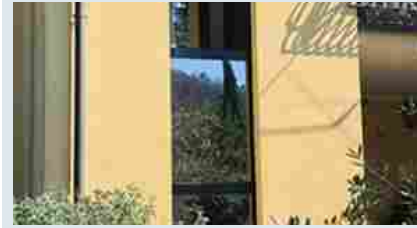
Appartamenti Borgo a Mozzano Località al Colle, frazione Diecimo