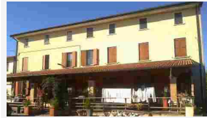
Appartamenti Cavarzere località San Gaetano 39 - 83771

«Penso all'agenzia che rappresento, abbiamo un bilancio annuale di 10 miliardi e mezzo di dollari. In genere otteniamo finanziamenti per il 50-60%, poi lavoriamo sulle priorità. L'Italia ha contribuito molto in questi anni, ma chiediamo a tutti uno sforzo in più. Quest'anno per arrivare a non ridurre operazioni che abbiamo