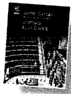
IL LIBRO "Anatomia di un istante", in questi giorni in libreria edito da Guanda. A destra, Tejero in Parlamento durante il golpe