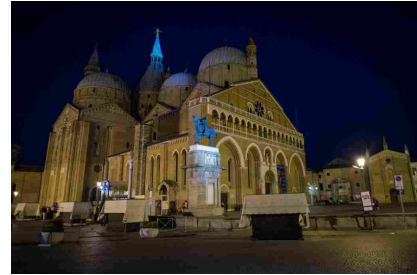
Padova: anime verdi, il festival dei giardini aperti

Ritaglio stampa ad uso esclusivo del destinatario, non riproducibile.