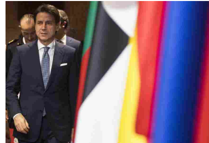
Il premier Conte al Festival dello Sviluppo Sostenibile