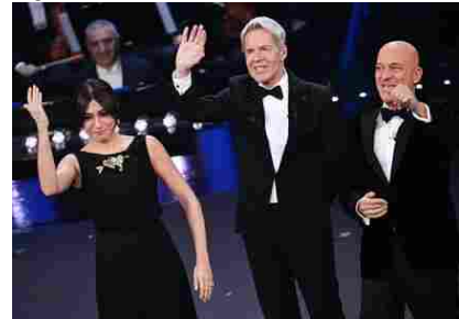
Festival noioso e troppo lungo perde pericolosamente pubblico