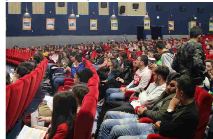
A Giffoni il lancio della settima edizione di Cinefrutta